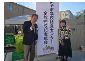
給食センター完成記念式典