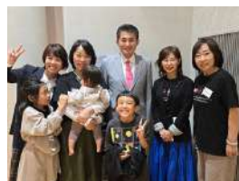
骨髄バンク上映会