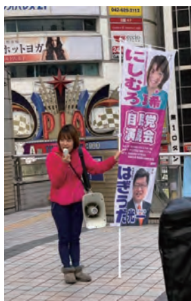
手を振って頂けると、とても嬉しいです。