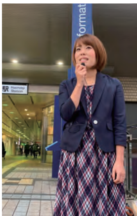
八王子駅の北口駅前にて朝の演説中！