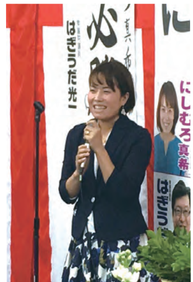
八日町の甲州街道沿いに事務所を開設しました。夢美術館の斜向かいです。