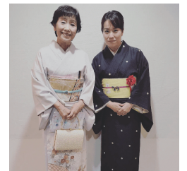
ふれあい財団20周年