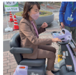
スマートシティ視察