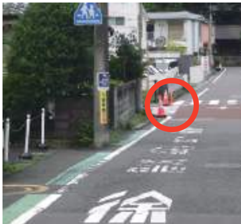
施工後は横断歩道が見えるようになったので歩行者の有無の確認も容易になりました。