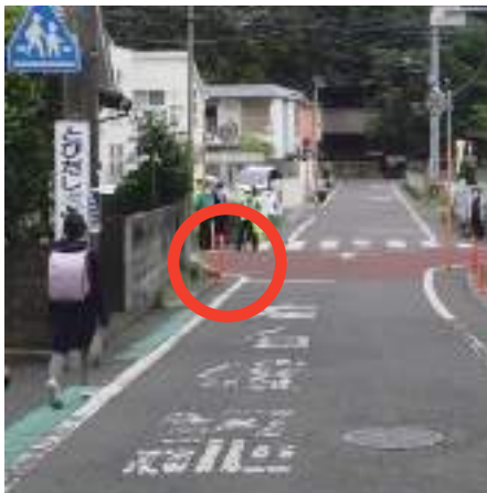
施工前は横断歩道が車から見えず、左折時に歩行者が巻き込まれる可能性が高くなっていました。

市民の皆様よりご指摘いただきました箇所の道路整備やカーブミラーの設置を行いました！ 一番大きく掲載させていただいた写真は長年、地域の皆様が危険箇所として懸念していた通学路の改善です。 所属しております会派の仲間と実現いたしました！