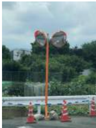
街中の危険箇所も整備をし、より安全に通行できるようにしました。