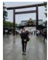
○靖国神社昇殿参拝